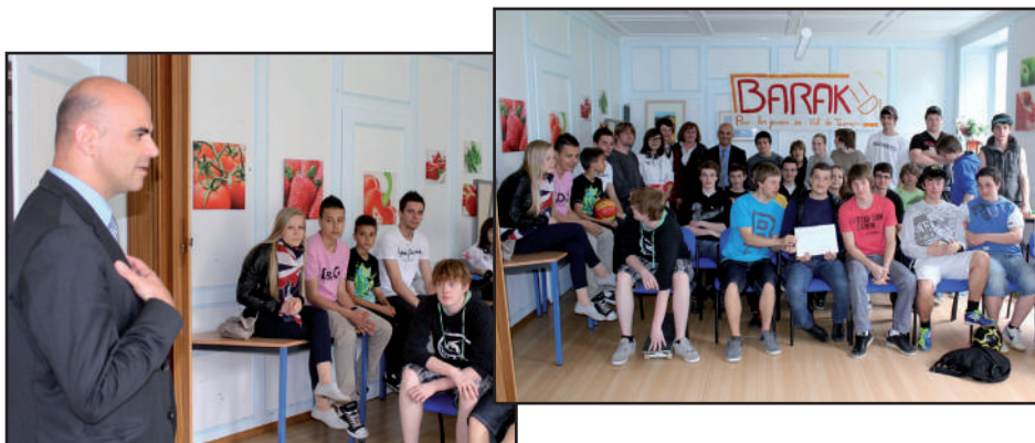
Visite du Conseiller Fédéral Alain Berset, 1er mai 2012

Le comité s'est réuni plusieurs fois dans l'année pour traiter les nouveaux défis: contrats d'assurances, achat d'un frigo, achat de vaisselle, acquisition de mur de roseaux pour partager l'espace, mise en place de toiles pour diminuer la hauteur du plafond, procédures en cas d'accidents, élargissement de la couverture d'assurance aux bris de glace, organisation de l'élection des délégués des jeunes, achat de raquettes de ping-pong, lessive, nettoyage, etc. Il a tout fait pour que le centre fonctionne et accueille les jeunes d'une façon optimale. La réception traditionnelle de l'Abbaye s'est déroulée harmonieusement. Des contrats d'utilisation